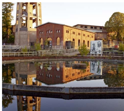
Salle des pompes