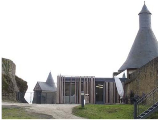
Nouvel accueil (Bourscheid)

Château de Bourscheid :, installation d'un nouvel escalier métallique sécurisé dans le donjon, travaux de transformation et de modernisation de l'accueil et de la terrasse, installation de portails d'entrée avec techniques spéciales intégrées, achèvement des études techniques et statiques pour la construction d'une annexe à la Maison de Stolzenbourg et début des travaux, élaboration d'un nouveau programme pour la Maison de Stolzenbourg, élaboration de plans pour la mise en sécurité du circuit extérieur.