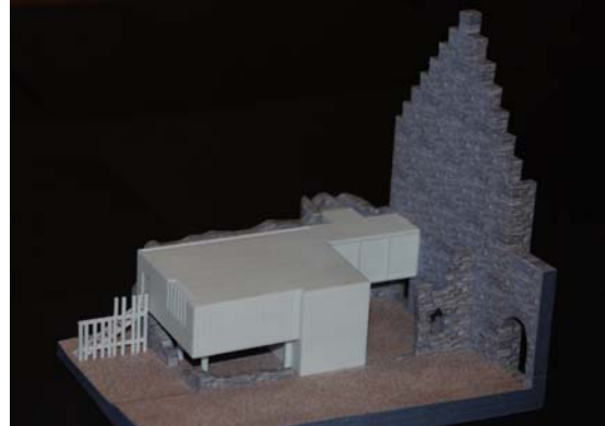
Maquette de l'annexe à la maison de Stolzenbourg (Bourscheid)

Château de Brandenburg : début des travaux pour la mise en place d'un circuit sécurisé (remblais, système de drainage, fondations en béton, gros-œuvre, forage et carottage).