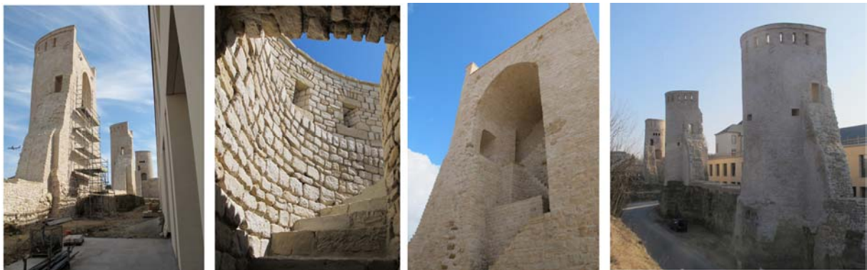
Tours médiévales du Rham (Luxembourg)

Enceinte fortifiée du Rham : travaux de consolidation et de remise en valeur des tours médiévales et des fortifications du 19 ème siècle.