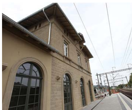
Gare de Noertzange

Gare de Noertzange : achèvement des travaux de restauration et de réaménagement en logements pour étudiants.