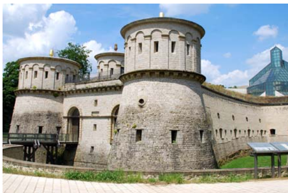
Musée Draï Eechelen (Luxembourg)

Reconversion du Fort Thüngen en Musée Draï Eechelen : achèvement des travaux de restauration et de la muséographie.